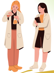
บุคลากร มหาวิทยาลัยราชภัฏ

การสนับสนุนทุนอุดหนุนการวิจัยและนวัตกรรมให้แก่บุคลากรที่ผ่านการฝึกอบรมฯ ให้เกิด งานวิจัยที่สร้างองค์ความรู้ใหม่นำไปใช้ประโยชน์เชิงพื้นที่ เชิงสาธารณะ หรือเชิงนโยบาย